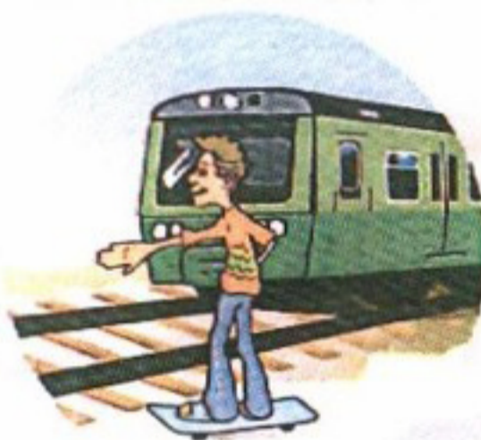
Кататься вблизи железной дороги.