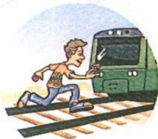
Перебегать пути перед поездом.

Слушать плеер и говорить по телефону, т. к. можно не услышать сигналы приближающегося поезда и объявления диктора.